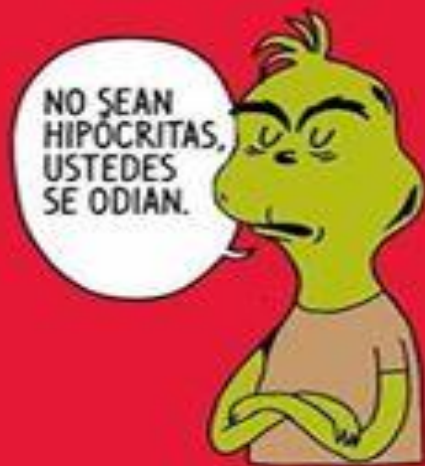
Grinch de Reunión Familiar