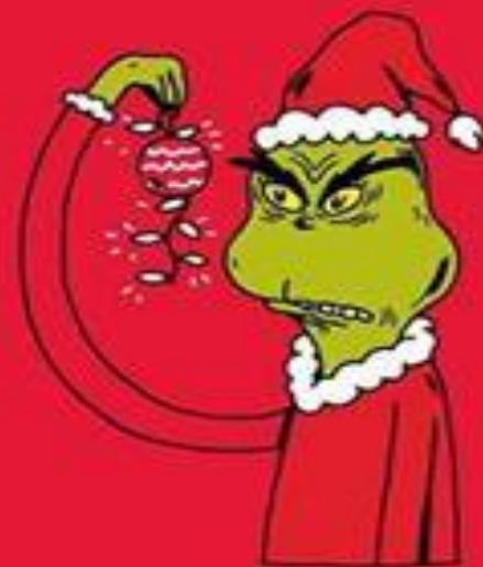
Grinch Grinch* (*todos los anteriores).